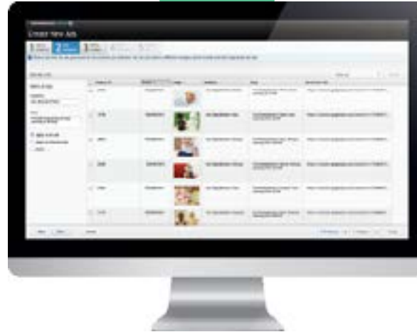
Personalizar anuncios con atributos dinámicos