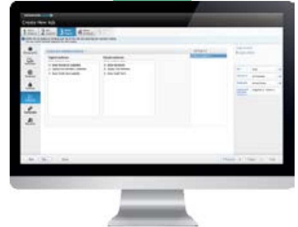
Llegar a clientes nuevos y a los ya existentes con públicos similares y personalizados

Resultados de Demand-Driven Campaigns (DDC) para un importante minorista