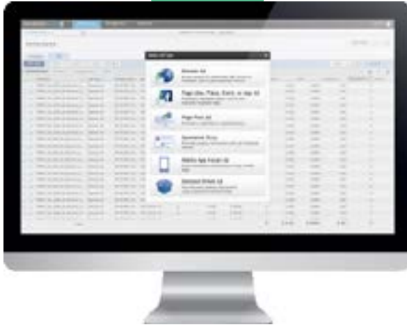
Crear campaña basada en la demanda